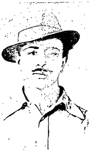
मरदार भगतसिंह फागो : 23 मार्च, 1931